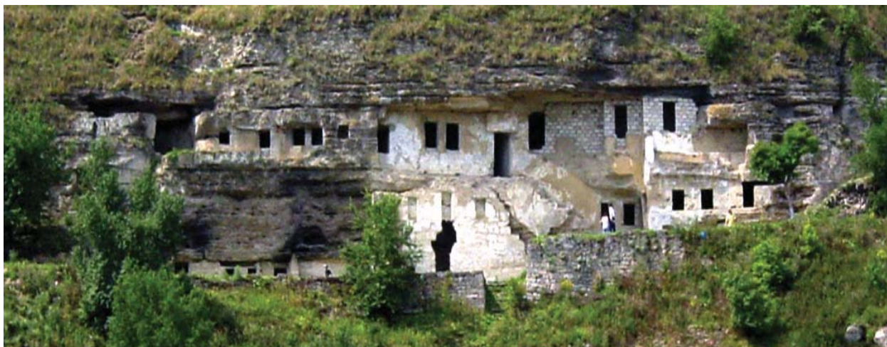
Mănăstirea rupestră Țipova, până la începutul lucrărilor de restaurare. Anul 2004

În anul 2000, istoricul Vlad Ghimpu, referindu-se la Complexul Monastic de la Horodiște-Țipova, care „se prezintă și astăzi drept cea mai impunătoare construcție rupestră cunoscută la noi sau în regiunile învecinate”, afirmă că acest locaș sfânt „a avut două stabilimente rupestre, înșiruite de-a lungul țărmlui abrupt al fluviului Nistru. Cel mai vechi s-a întins pe un singur nivel, mai la nord, al doilea, cu vreo 200 metri mai jos pe cursul râului și este dezvoltat în trei nivele” 11 . Partea mai veche a complexului, care este o construcție mai arhaică, după părerea autorului, este greu de evaluat „din pricina dărâmăturilor,” de aceea el presupune că „fondarea mănăstirii Horodiște-Țipova s-ar putea pune în legătură cu extinderea călugărilor de la mănăstirea Neamț care deținea în proprietate satul Horodiște, din ținutul Orhei, în anul 1631” 12 . Partea mai nouă a mănăstirii rupestre, care „se prezintă printr-o realizare a liniilor încăperilor la un grad mai avansat”, autorul o atribuie secolului XVIII, deoarece biserica de aici „puntează dezvoltarea